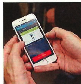
Le parcètre, bientôt désuet. Aldo Ellena

APPLICATION La ville de Fribourg lance son application permettant de payer la taxe de stationnement à l'aide de son téléphone. Léger hic: d'autres communes comme Guin et Bulle s'y sont déjà mis mais ont choisi un autre système. >> 12